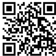
QR Code โหลดเอกสารการประชุม